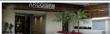
Adm ARCO/SPM Lojas Pátio ARCO