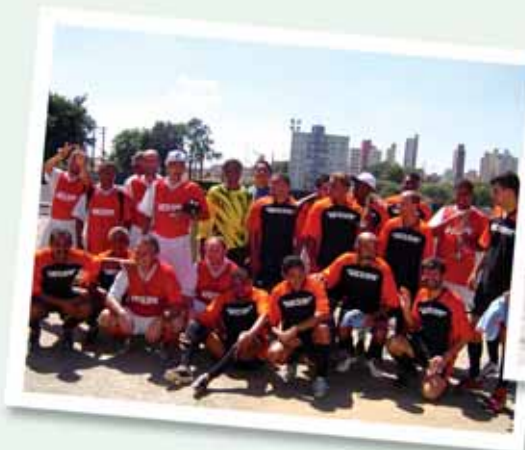
Em baixo: futebol de campo, atletismo e recorde de participantes na Escolinha de Esportes.