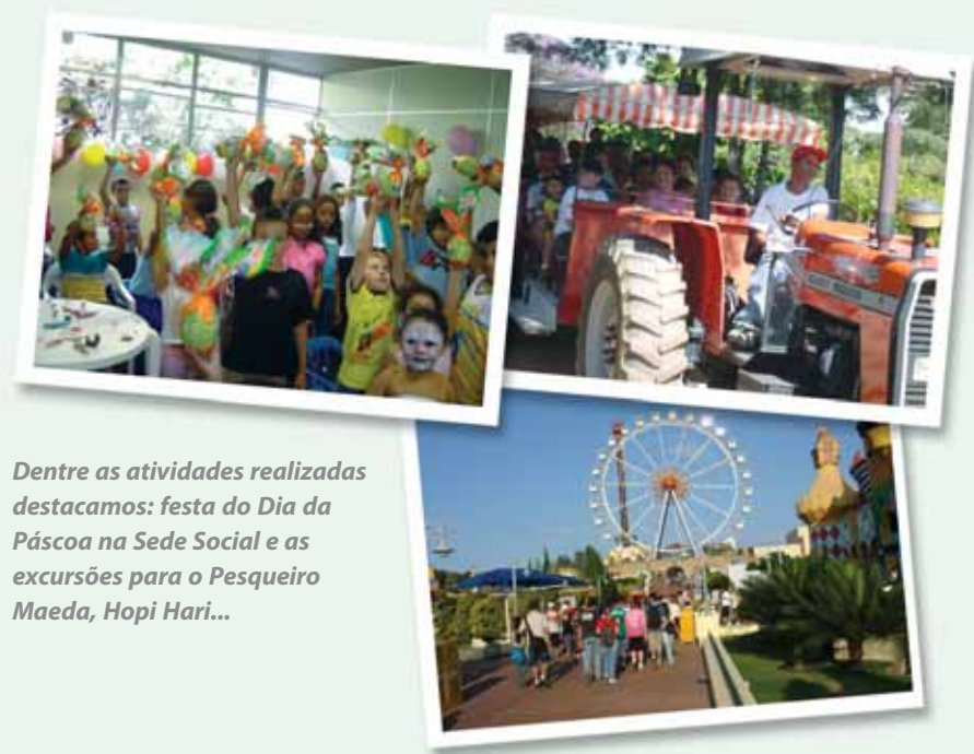
Dentre as atividades realizadas destacamos: festa do Dia da Páscoa na Sede Social e as excursões para o Pesqueiro Maeda, Hopi Hari...