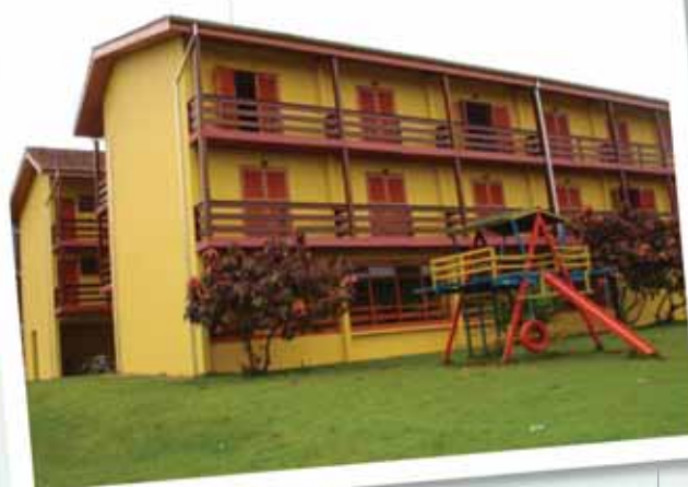
Melhorias no Residencial Caraguatatuba...