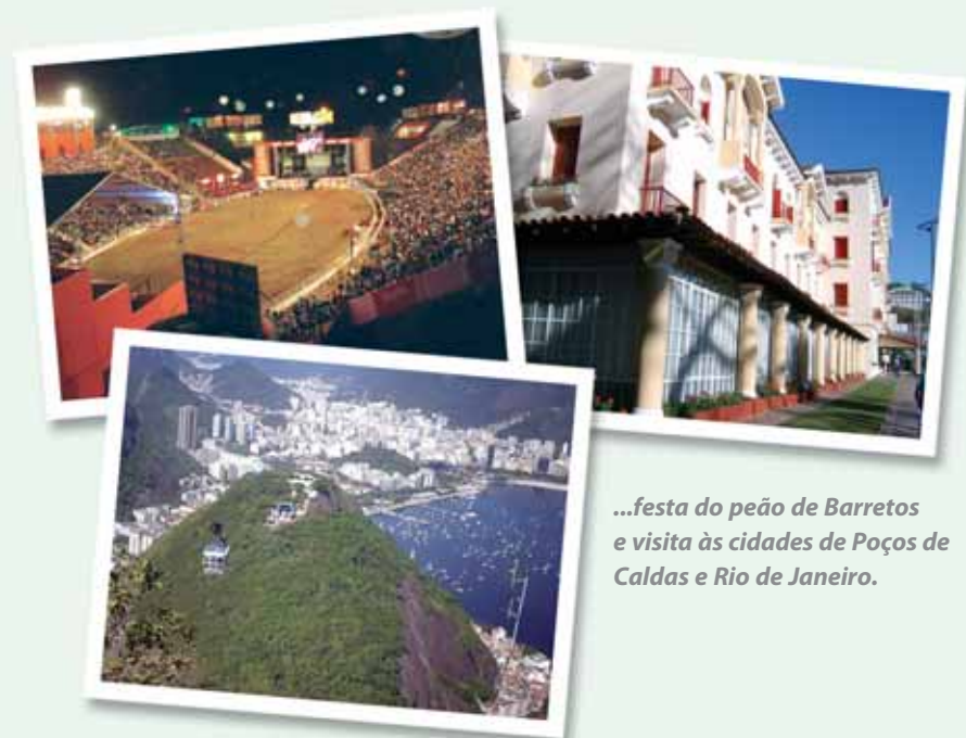
...festa do peão de Barretos e visita às cidades de Poços de Caldas e Rio de Janeiro.

Fechando o ano com chave de ouro e com um passeio inesquecível, 113 associados hospedaram-se em Copacabana, conheceram o Cristo Redentor, o Pão de Açúcar, além de todas as maravilhas da eterna cidade maravilhosa e cheia de encantos mil.