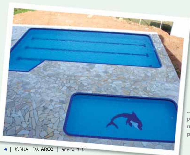
...destaque para as novas piscinas.