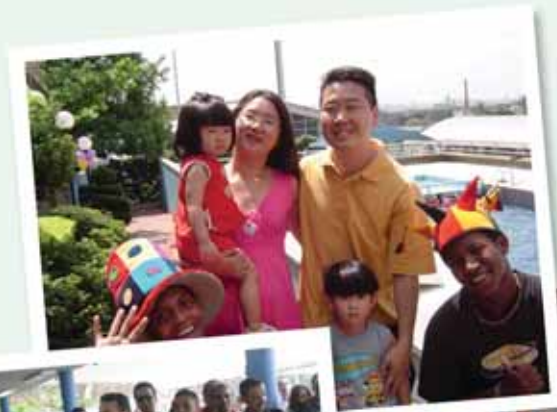
Ao lado, momento de descontração na comemoração do dia das crianças e abaixo Dia do Motociclista e equipe de basquete.