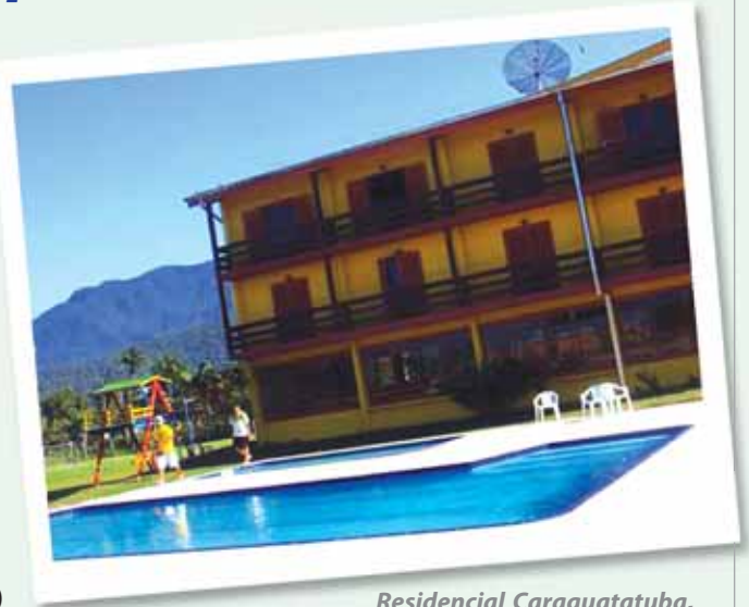
Residencial Caraguatatuba, infra-estrutura completa para seu lazer.

Das excursões realizadas destacamos a ida a cidade do Rio de Janeiro.