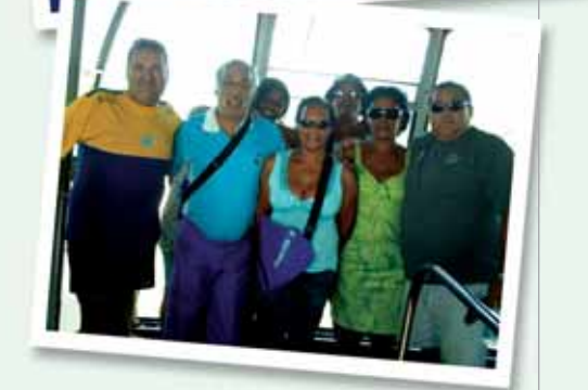
De cima para baixo: baile de aniversário ARCO, festa do Dia das Crianças na Sede Social e associados visitam o Rio de Janeiro.