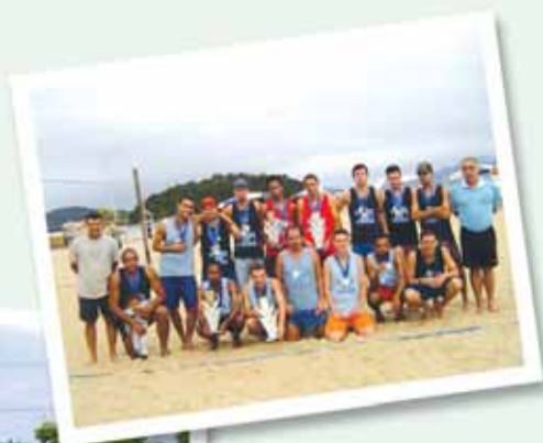
Equipes de vôlei de praia e futebol de campo.

Em parceria com os CORREIOS, a ARCO organizou e desenvolveu a fase seletiva dos Jogos Internos dos Correios 2006. Com início em 26 de agosto fizeram parte da competição as modalidades: futebol de campo, futsal principal feminino, masculino e infantil, futsal master, cabo de guerra feminino e masculino, vôlei de quadra feminino e masculino, vôlei de areia feminino e masculino, basquetebol, damas, dominó, tênis de mesa, xadrez, truco, tênis de campo, sinuca, atletismo e natação. Ao todo, mais de 5.000 atletas participaram nas finais realizadas nos dias 26 de novembro na ADC Eletropaulo, 3 de dezembro no SESI Santo André e 10 de dezembro no SESI Osasco. Com um número recorde de participantes e torcedores, foram servidos 1.000 Kg de carne, 800 garrafas de refrigerantes, saladas e muita fruta.